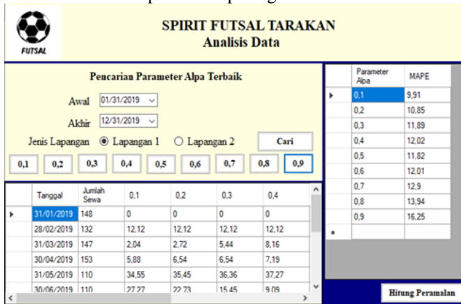
Gambar 1 Uji Coba Program Analisis Data

Pada form analisis data, yang dilakukan pertama kali adalah memasukkan tanggal dan jenis lapangan akan dicari nilai MAPEnya. Kemudian klik tombol cari untuk menampilkan data. Setelah data tampil, kemudian klik tombol 0,1 sampai dengan 0,9 untuk menampilkan nilai MAPE. Dari hasil tersebut, dapat diketahui parameter alpa yang memiliki MAPE terkecil. Dapat dilihat pada gambar 1.